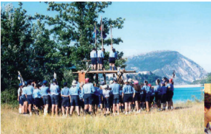
Da sempre divisi tra acqua e montagna