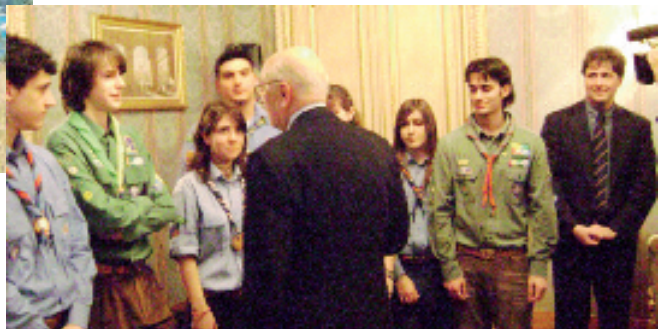
La nostra delegazione dal Presidente Napolitano