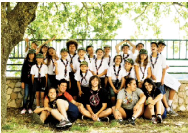
La nostra forza, il nostro futuro, la nostra allegria