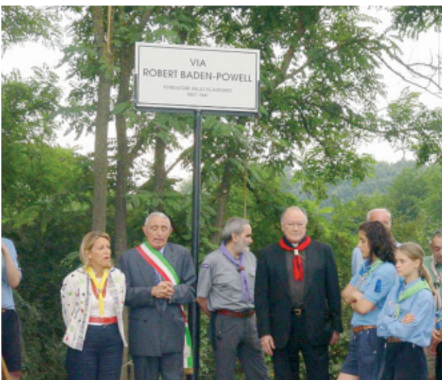
2 luglio - Le autorità all'intitolazione di Via Baden-Powell