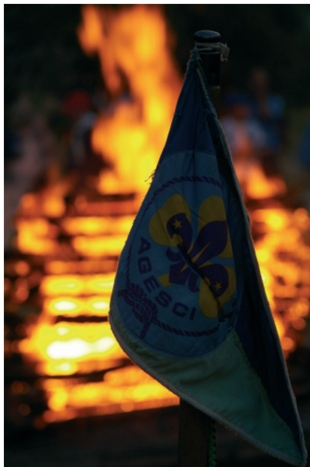
L'accensione del fuoco alla cerimonia del 2 luglio