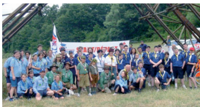
2 luglio - Foto di gruppo