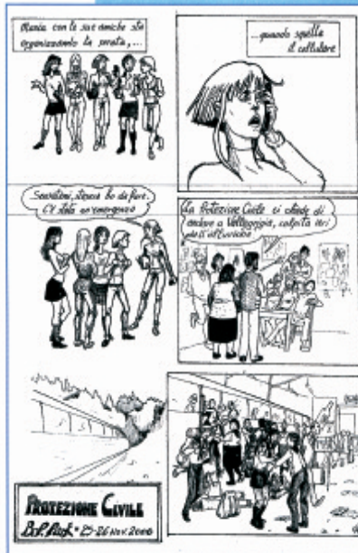
Fumetto celebrativo del test presso il BP Park del 25 e 26 novembre scorso

Non è mancata la "stazione" adibita a cucina in cui i ragazzi si sono impegnati, a turni di venti, nella preparazione di un pranzo per la collettività (cottura e "dosaggio") e nella predisposizione delle strutture necessarie per la consumazione dello stesso. Nelle restanti stazioni i ragazzi hanno acquisito le nozioni base per l'animazione di bambini e ragazzi in situazioni di emergenza di protezione civile, impegnandosi nel montaggio e smontaggio di tendoni adibiti a tale scopo.