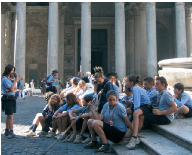
6 agosto - Consegna del riconoscimento "Terra e pace"

Bassano Romano o di prenotare i posti per le udienze del Papa oltre a chi si è fatto carico di organizzare l'ospitalità a Roma – presso la Parrocchia di S.Giuseppe all'Aurelio – per le unità scout.