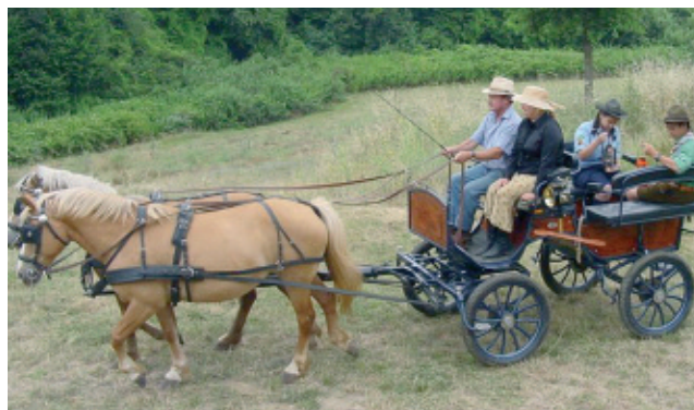
2 luglio - L'arrivo della fiamma

«...Carissimi amici, seguire Gesù vuol dire dare una direzione sicura alla propria vita di uomini e di cristiani, nel segno della libertà e dell'amore. Giungendo a noi la fiamma di Baden-Powell, mi piace pensare che quella fiamma sia come un segno di Cristo stesso che diventa per noi la fonte che riscalda il nostro cuore e che illumina la nostra intelligenza...».