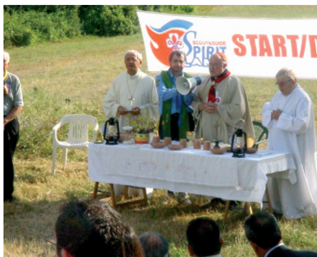
2 luglio - La S.Messa