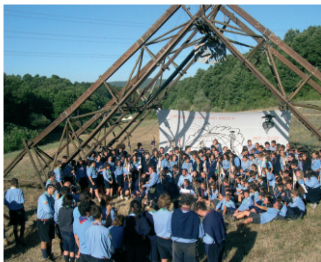
1° agosto - L'Alba dello scautismo