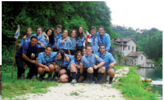
Campo di Reparto 2014