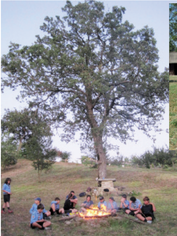
Campo di Reparto 2010