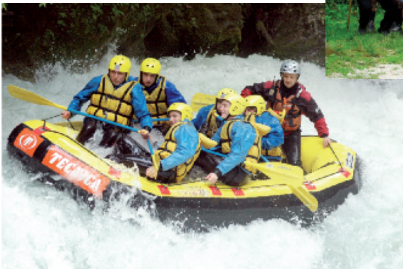
Uscita di Clan nel 2008 rafting alle cascate delle Marmore