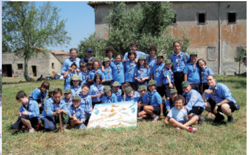
Vacanze di Branco 2010 ad Oriolo Romano