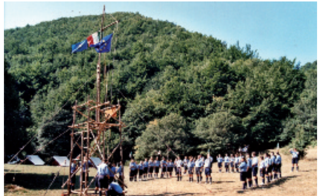
Campo E/G a M.te Cavallo