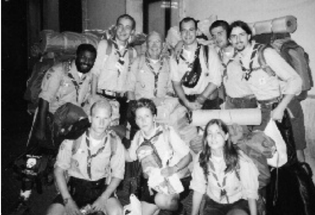
Partenza Route Dolomiti