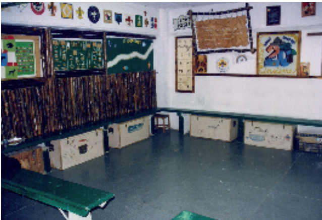
Una delle sedi (Reparto)