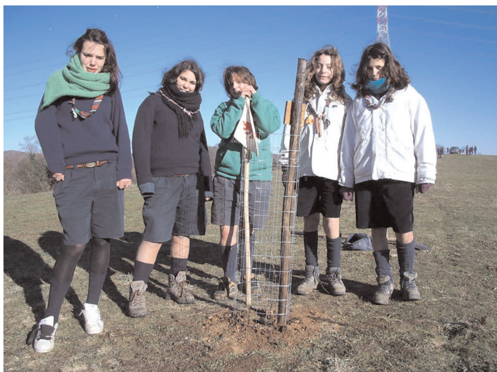
La squadriglia Tartarughe del Roma 24 accanto al "suo" albero

«Il primo elemento importante è essere un'area grande e ben strutturata per le attività scout, ad un passo da Roma: anche noi avvertiamo la crescente difficoltà di reperire aree dove campeggiare, e Bassano Romano ci sembra un'oasi nel deserto. E poi, ripeto, mi pare importante cogliere ora la valenza – anche simbolica – dell'ingresso come soci nella struttura: portiamo il nostro contributo alla costruzione di una casa comune per lo scautismo. Non è impresa facile, ma è affascinante provarci; e – se lavoriamo insieme – possiamo davvero fare bene».