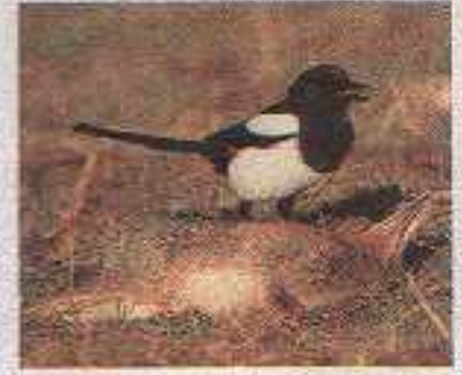
Durante i mesi più difficili dell'anno la dieta delle gazze comprende un numero elevato di cerogno, comprese le "vittime della strada". Gli uccelli si nutrono lungo le strade trafficate nella prima ora del mattino.