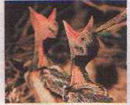
Quando i piccoli sono nati in maggio, le gazze vanno spesso a fare razzie nei nidi altrui. I giovani, che lasciano il nido alla fine del mese, si riconoscono facilmente per la coda corta.