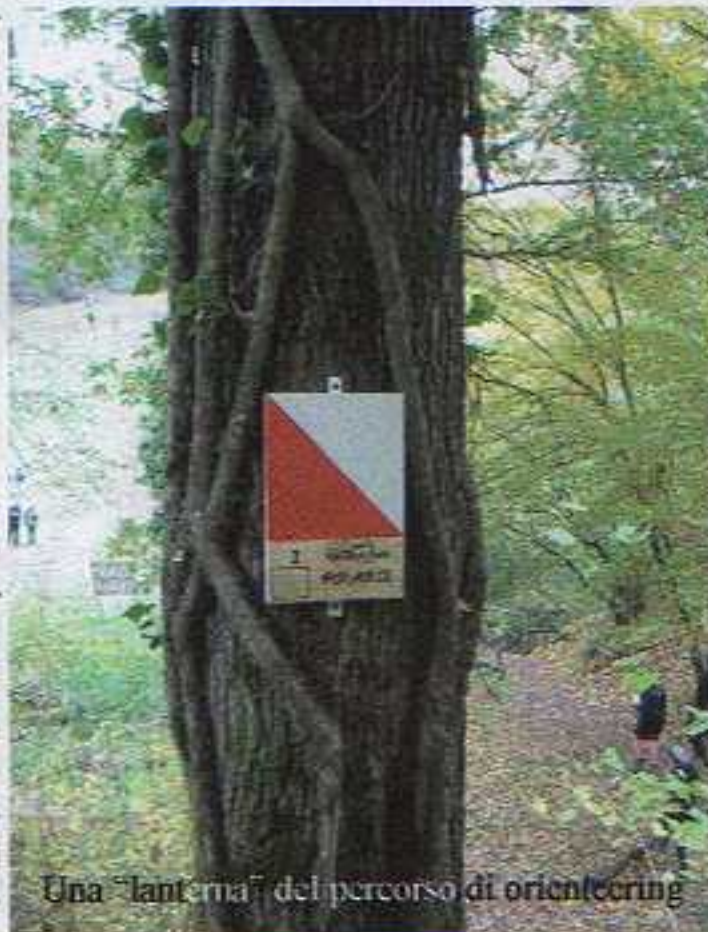
Una "lanterna" del percorso di orienteering