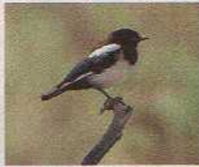
I giovani diventano indipendenti e sono in grado di spostarsi in zone vicine: a volte solo per alcune centinaia di metri, ma nelle zone meno favorevoli il viaggio può essere lungo anche diversi chilometri.