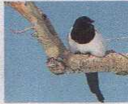
Le gazze cominciano a ristabilire i propri territori. Diverse zone saranno occupate da coppie già formate, ma altre ospiteranno gruppetti relativamente numerosi di uccelli non accoppiati che vivono insieme.