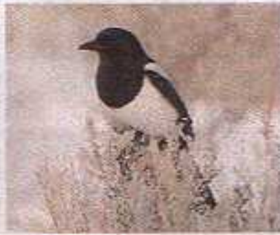
Le coppie territoriali cominciano a costruire il nido in gennaio: infatti questa impresa richiede parecchio tempo, fino a otto settimane. Le coppie scacciano aggressivamente gli intrusi del loro territorio.