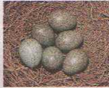
Di solito la deposizione delle uova raggiunge il culmine all'inizio di aprile. Le gazze non sono immuni ai predatori di nidi e si difendono rumorosamente contro le sgradite attenzioni di altri conidi.