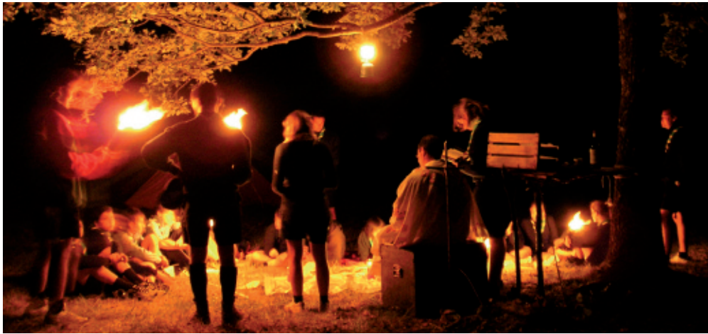
B.-P. PARK – CONCORSO FOTOGRAFICO 2007 - PREMIO SPECIALE ALLA MIGLIOR FOTO RELIGIOSA: MESSA DI FINE CAMPO ESTIVO, di Luca Sangalli – Gruppo scout AGESCI Brugherio 1 (MI)