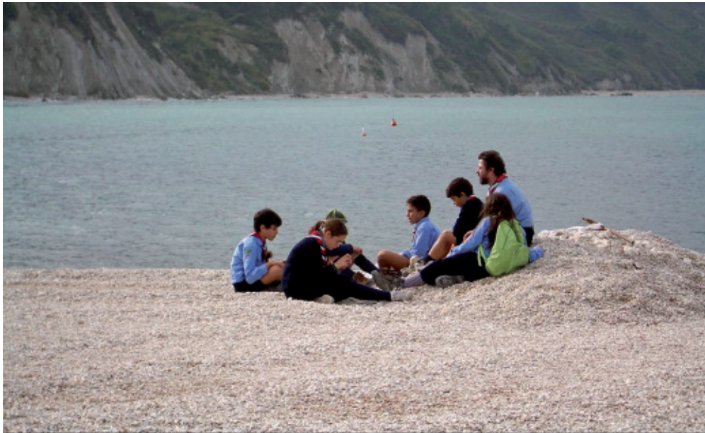
B.-P. PARK – CONCORSO FOTOGRAFICO 2007 - PREMIO SPECIALE ALLA MIGLIOR FOTO SCATTATA DA UN LUPETTO/COCCINELLA: RIFLESSIONE , di Alessandro Bisogni – Gruppo scout AGESCI Ancona 9