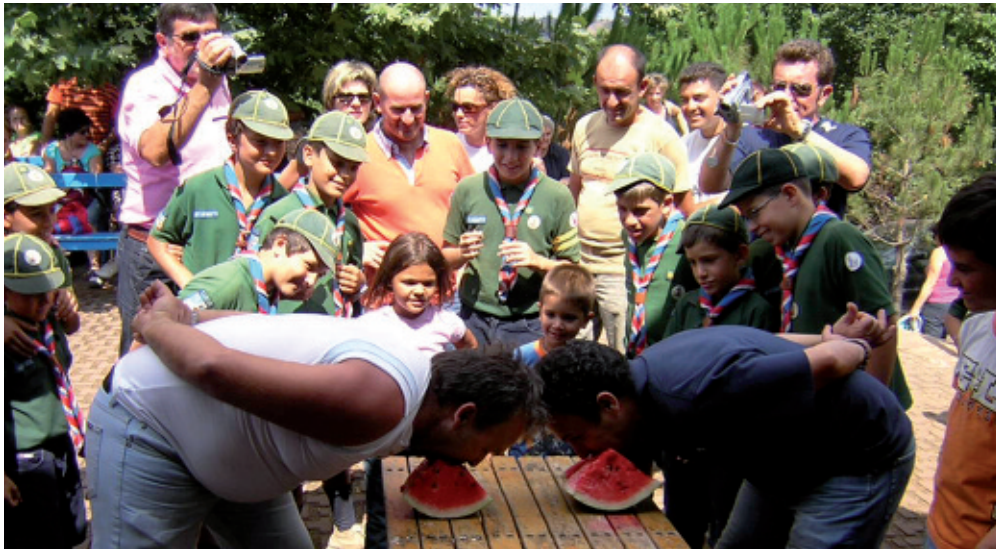
B.-P. PARK – CONCORSO FOTOGRAFICO 2007 – 1° CLASSIFICATO: GIORNATA DEI GENITORI, di Marco Fiore- Gruppo scout Mislimeri 2 (PA) dell'Associazione Guide e Scouts San Benedetto