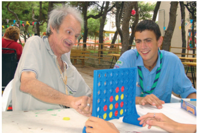
3° classificato: TUTTO COL GIOCO NIENTE PER GIOCO di Roberto Costantini Gruppo: Agesci - Pesaro 2 (PU)