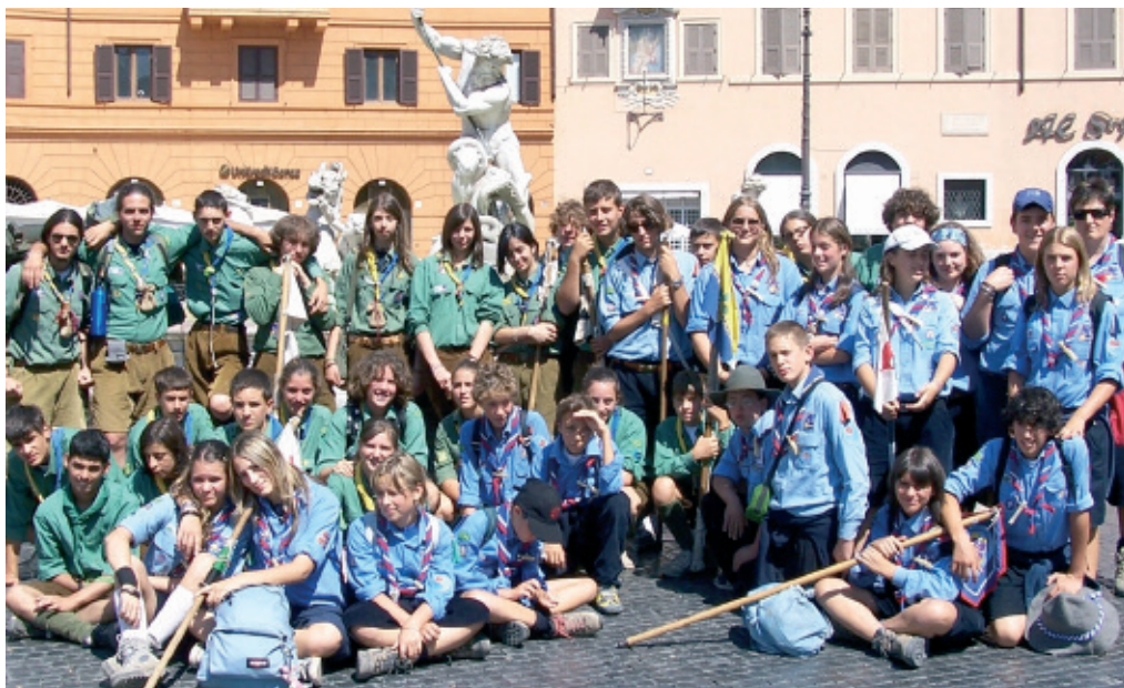
B.-P. PARK - CONCORSO FOTOGRAFICO 2007 - Premio speciale alla miglior foto scattata ad un campo a B.-P. Park: COMMEMORAZIONE "MAI PÙ HIROSHIMA" AL PANTHEON Gruppo scout AGESCI Manciano 1 (GR)