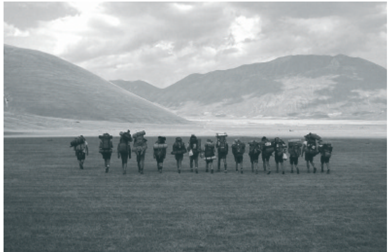
2° classificato: ALL TOGETHER, ON THE ROAD AGAIN di Matteo Evangelisti AGESCI; gruppo Cesena 6 (FC)

Gruppo Manciano 1 (AGESCI): COMMEMORAZIONE "MAI PIÙ HIROSHIMA" AL PANTHEON. Vince una tenda da campeggio per 3 persone.